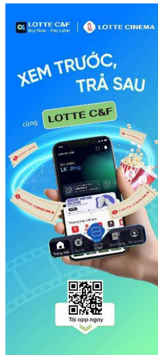
ロッテシネマ・ベトナムとの コラボレーション広告デザイン

当グループの映画館事業を行うロッテシネマ・ベトナムでのサービス開始を皮切りとして、今後はベトナムで事業を展開する小売店舗、サービス店舗、eコマースサービスの加盟店を順次拡大していきます。