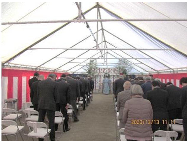
【土地区画整理事業区域】

2023年12月13日、快晴の下、業務代行者（工事）大成建設株式会社主催による起工式を実施いたしました。当日は、行政や地権者の方々等関係者約50名が出席し、これから約2年間に渡る工事の安全を祈願いたしました。